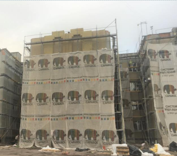
Початок впровадження заходів з енергозбереження