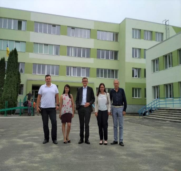
Початкова зустріч щодо проєкту